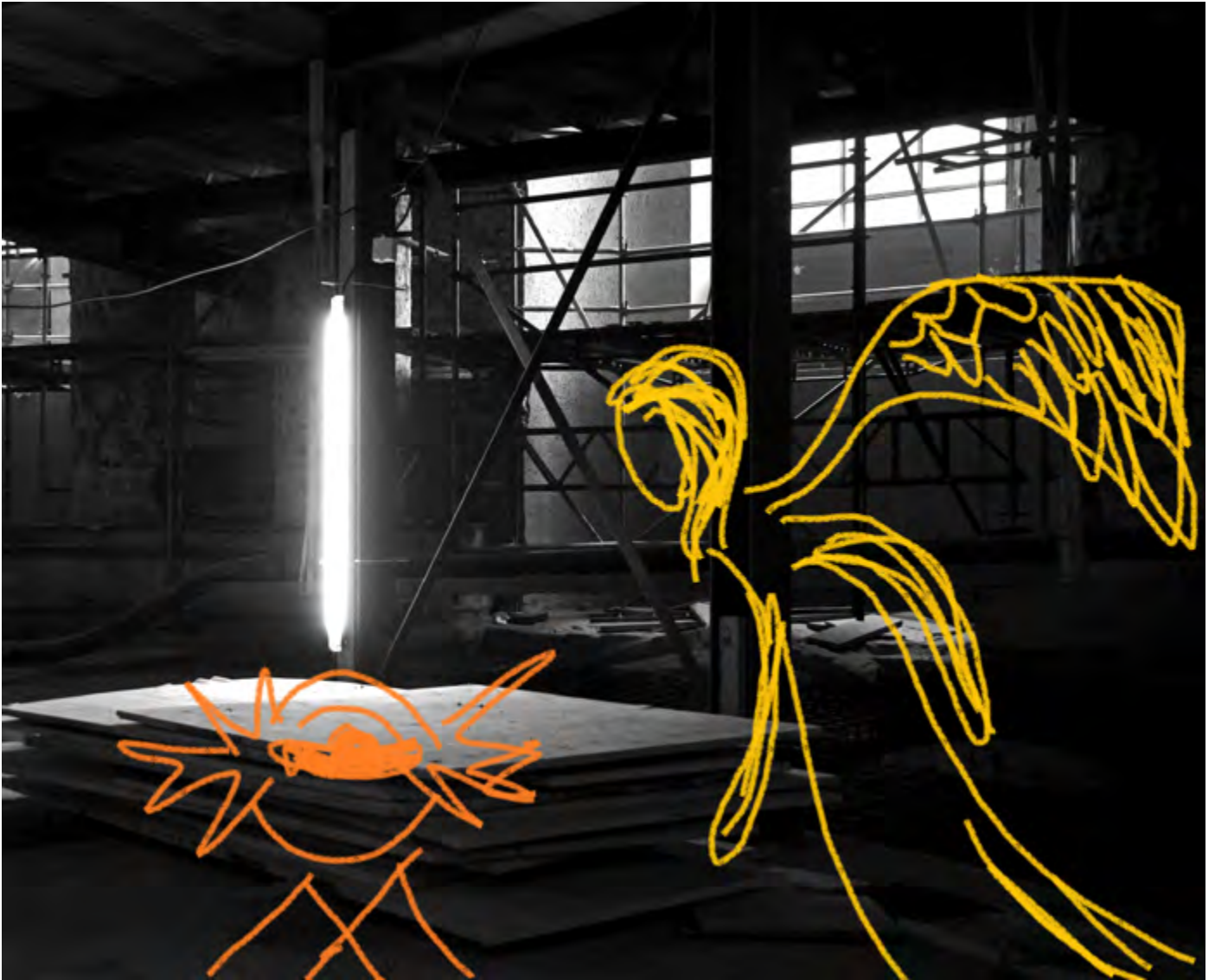
Bild: Peter Weidemann (Foto), Gunda Brüske (Illustration/Komposition) In: Pfarrbriefservice.de